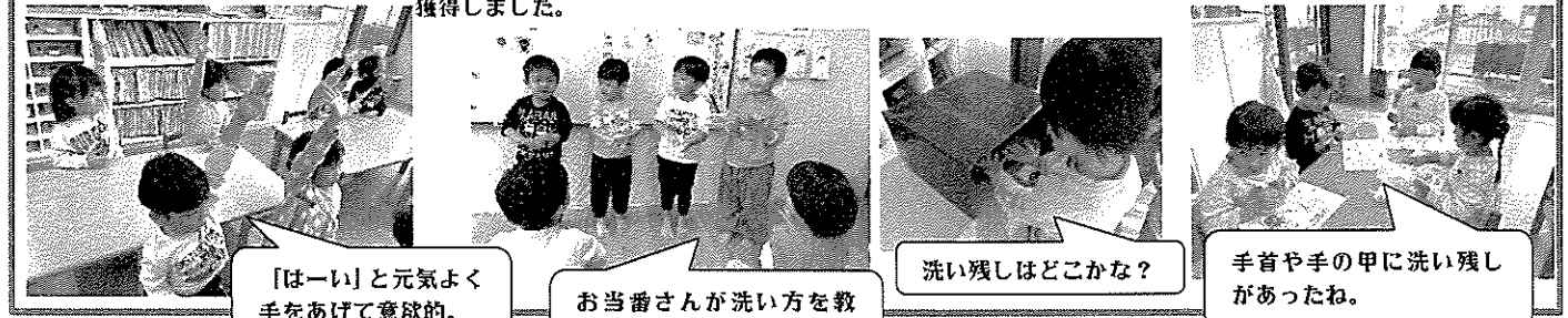
「はい」と元気よく手をあげて意欲的。

とにかく元気なはな組さん。質問したら答えたくて、手の平をピンとして「私を指して〜」とアピール。色々な答えが返ってきて面白かったです。フラックライトでは洗い残しが多かったため、全員2回チャレンジ。合格してダフルシールを獲得しました。